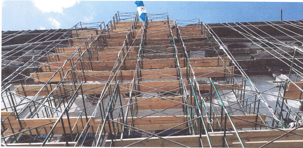
Inspección de la colocación de Andamios en la zona central del Palacio Nacional de la Cultura