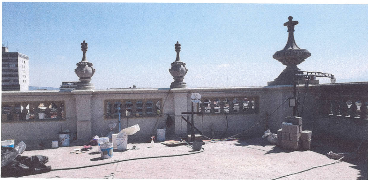
Inspección de los trabajos realizados en ornamentos y balaustradas del Torreón Presidencial de la fachada sur del Palacio Nacional de la Cultura